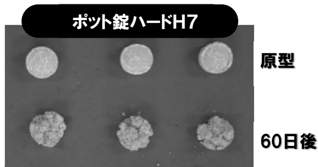
写真下段:60日後の錠剤の残存状態(例) ※注:降雨や灌水量によっても変わる場合があります。