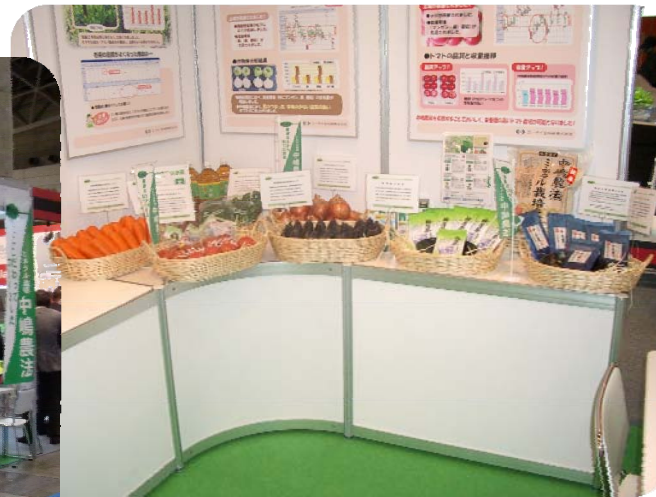
中嶋農法農産物を展示