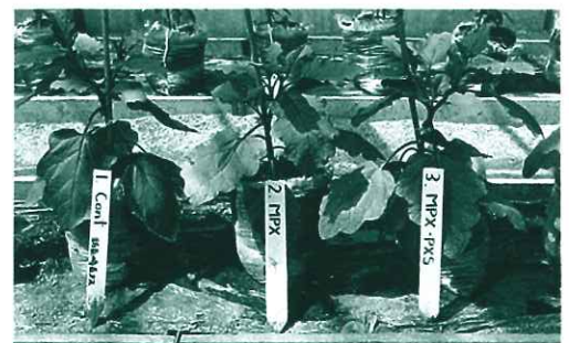
対 照 区