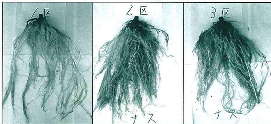
対 照 区